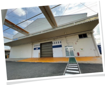
神野 テクニカルセンター