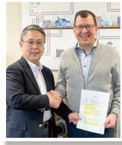
弊社社長（左）と握手をする Heat Flex製造協会の 代表取締役社長（右）

30年以上の販売実績がある「温泉パイプ」は業界内でも汎用化され 温水、温泉、融雪、傷防止などの用途で全国各地の配管に使用され ています。一方、世界的に見ても日本は地震大国でありライフライン を軸に国内配管は耐震管路化が進んでいます。また日本の温泉は泉 質により腐食性があり管路の長期寿命化も求められています。 今回、販売開始するHeat Flexは現行品の良い部分を継承し、より ユーザー様のニーズに寄り添った最新モデルになります。