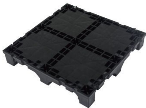
NP-40A（シリーズ中、最も低床）

パネルの高さ違いを4タイプ（H=40mm、50mm、75mm、93mm）用意しました。床下の配線容量や天井高に応じて、お選び頂けます。縦横寸法は全タイプ250mm角です。