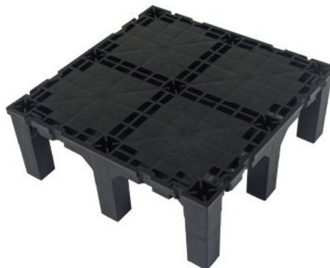
NP-93A（とにかく大容量配線ならこれ）